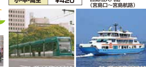
イメージ(R)