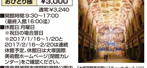
大塚国際美術館ステイナールホール(H)