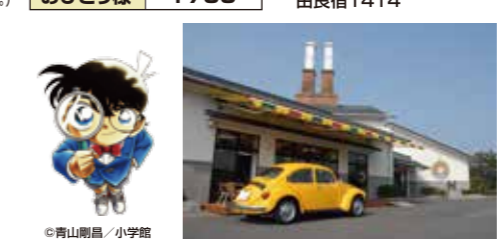
青山剛昌 / 小学館