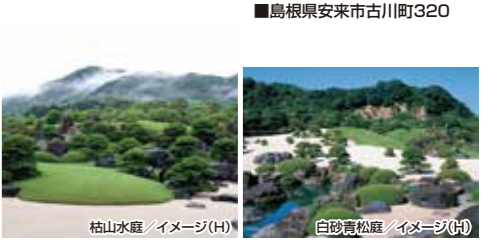
白砂青松園 / イメージ(H)